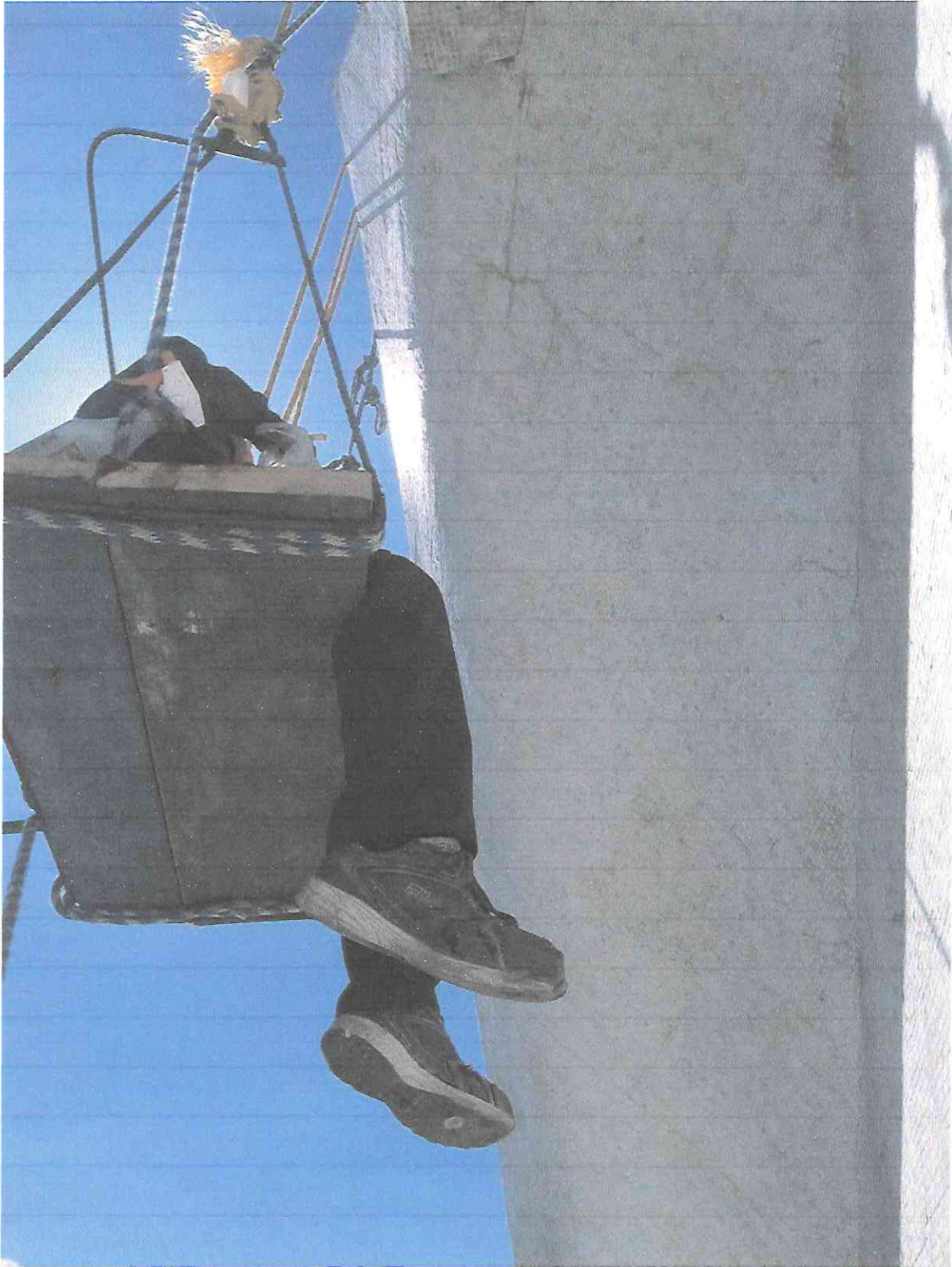
Limpieza de tesela limpia en el sector B1.